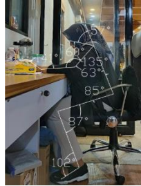
Gambar 2. Postur Tubuh Pegawai Divisi FAT

Metode RULA digunakan untuk menilai dan mengidentifikasi postur tubuh yang berpotensi menimbulkan cedera muskuloskeletal , dengan memberikan skor pada berbagai bagian tubuh, seperti posisi lengan, tangan, pergelangan tangan, dan postur tubuh bagian atas lainnya [25].