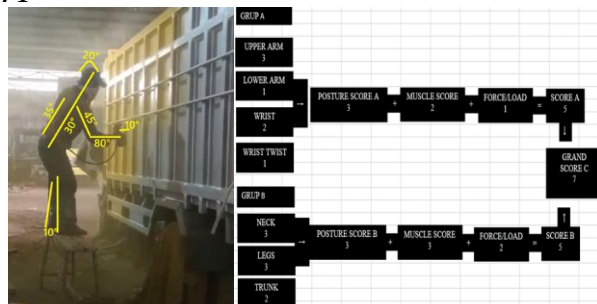
Gambar 5. Hasil Penilaian Postur Kerja Menggunakan Metode RULA pada Operator 1