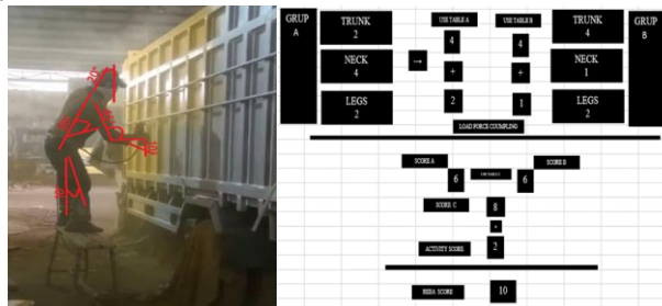
Gambar 4. Hasil Penilaian Postur Kerja Menggunakan Metode REBA pada Operator 1

Berdasarkan hasil pengamatan pada aktivitas pengecatan bak dump truck, Operator 1 bekerja dengan posisi berdiri di atas pijakan kecil sambil memegang spray gun. Postur tubuh operator menunjukkan adanya fleksi pada batang tubuh, leher menunduk, lengan atas terangkat, dan pergelangan tangan sedikit menekuk selama proses pengecatan berlangsung.