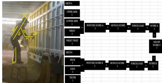
Gambar 7. Hasil Penilaian Postur Kerja Menggunakan Metode RULA pada Operator 2

Berdasarkan hasil pengamatan pada aktivitas pengecatan bak dump truck, Operator 2 bekerja dengan posisi berdiri di atas pijakan kecil sambil memegang spray gun. Postur tubuh operator menunjukkan adanya fleksi pada leher, batang tubuh membungkuk, lengan atas kanan terangkat, lengan bawah membentuk sudut tertentu, pergelangan tangan menekuk, serta kaki bertumpu pada pijakan kecil. Kondisi tersebut menunjukkan bahwa beberapa bagian tubuh operator berada pada posisi tidak netral selama proses pengecatan berlangsung.