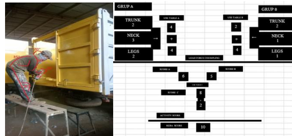
Gambar 6. Hasil Penilaian Postur Kerja Menggunakan Metode REBA pada Operator 2

Berdasarkan hasil pengamatan pada aktivitas pengecatan bak dump truck, Operator 2 bekerja dengan posisi berdiri di atas pijakan kecil sambil memegang spray gun. Postur tubuh operator menunjukkan adanya fleksi pada leher, batang tubuh membungkuk, lengan atas kanan terangkat, pergelangan tangan sedikit menekuk, serta kaki bertumpu pada pijakan kecil. Kondisi tersebut menunjukkan bahwa beberapa bagian tubuh operator berada pada posisi tidak netral selama proses pengecatan berlangsung.