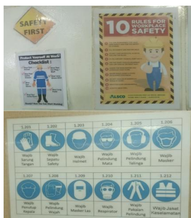
Gambar 3. Dokumentasi SOP Kamar Mesin

Selain kepatuhan penggunaan APD, kedisiplinan kerja awak kapal turut diperkuat oleh ketersediaan Standar Operasional Prosedur (SOP) keselamatan yang terpasang di lokasi-lokasi strategis, khususnya di dalam area kamar mesin. SOP tersebut memuat instruksi teknis dan peringatan bahaya yang secara spesifik disesuaikan dengan profil risiko dari masing-masing pekerjaan. Keberadaan pedoman tertulis yang mudah dibaca ini berfungsi sebagai sistem navigasi perilaku bagi kru, memastikan setiap tindakan operasional berjalan secara terarah, aman, dan mematuhi regulasi yang telah ditetapkan.